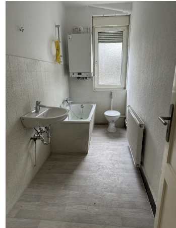
Tageslichtbad mit Badewanne